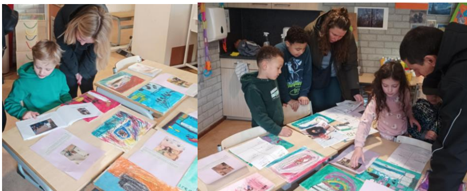
Tentoonstelling Van Gogh

De betrokken medewerkers vertellen u graag meer en heten u van harte welkom voor een rondleiding op woensdag 16 april!