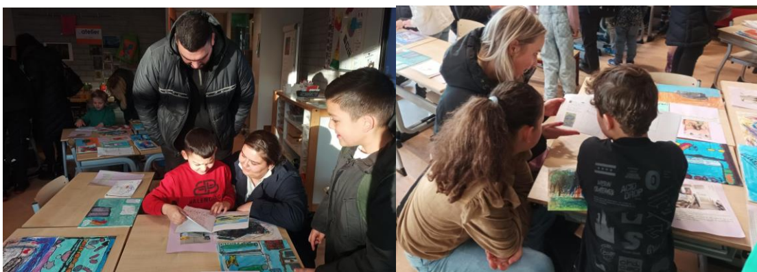
Tentoonstelling Van Gogh. Miles: Onze papa's en mama's kijken naar ons schilderij