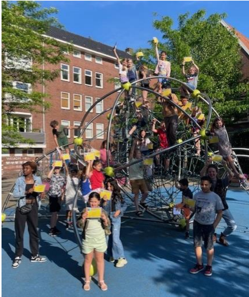
Deelnemers W4Kangoeroewedstrijd rekenen