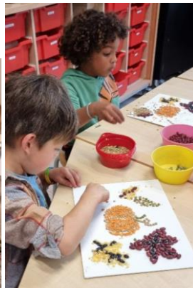
TSA Kunstatelier 1-2