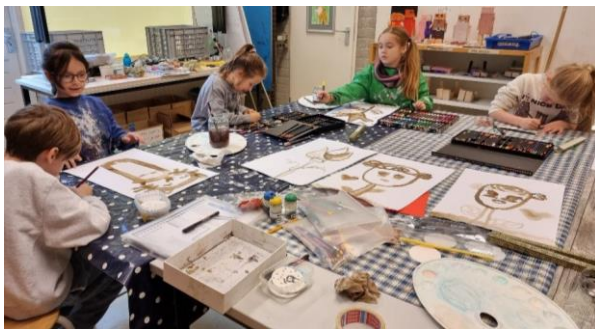
TSA Tekenen en schilderen 3-4-5

Zoals je daar kunt zien, maak je al een groot verschil met regelmatig een gezellige speeldate. Zin om een steungezin te worden? Of kunnen jullie zelf wat steun gebruiken? Neem dan gerust contact op met Shanna, coördinator van Buurtgezinnen in Amsterdam-West via shanna@buurtgezinnen.nl of 0648683530."