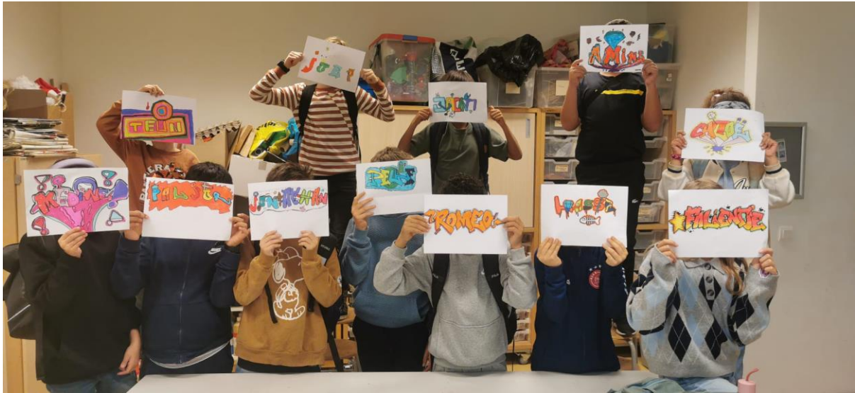
TSA Graffiti 6-7