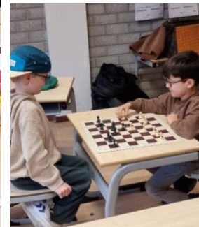
TSA Schaken 3-4-5